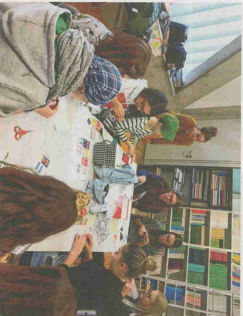
Studenti psihologije prethodnih su godina izradivali promo predmete koji su se prodavali u humanitarne svrhe